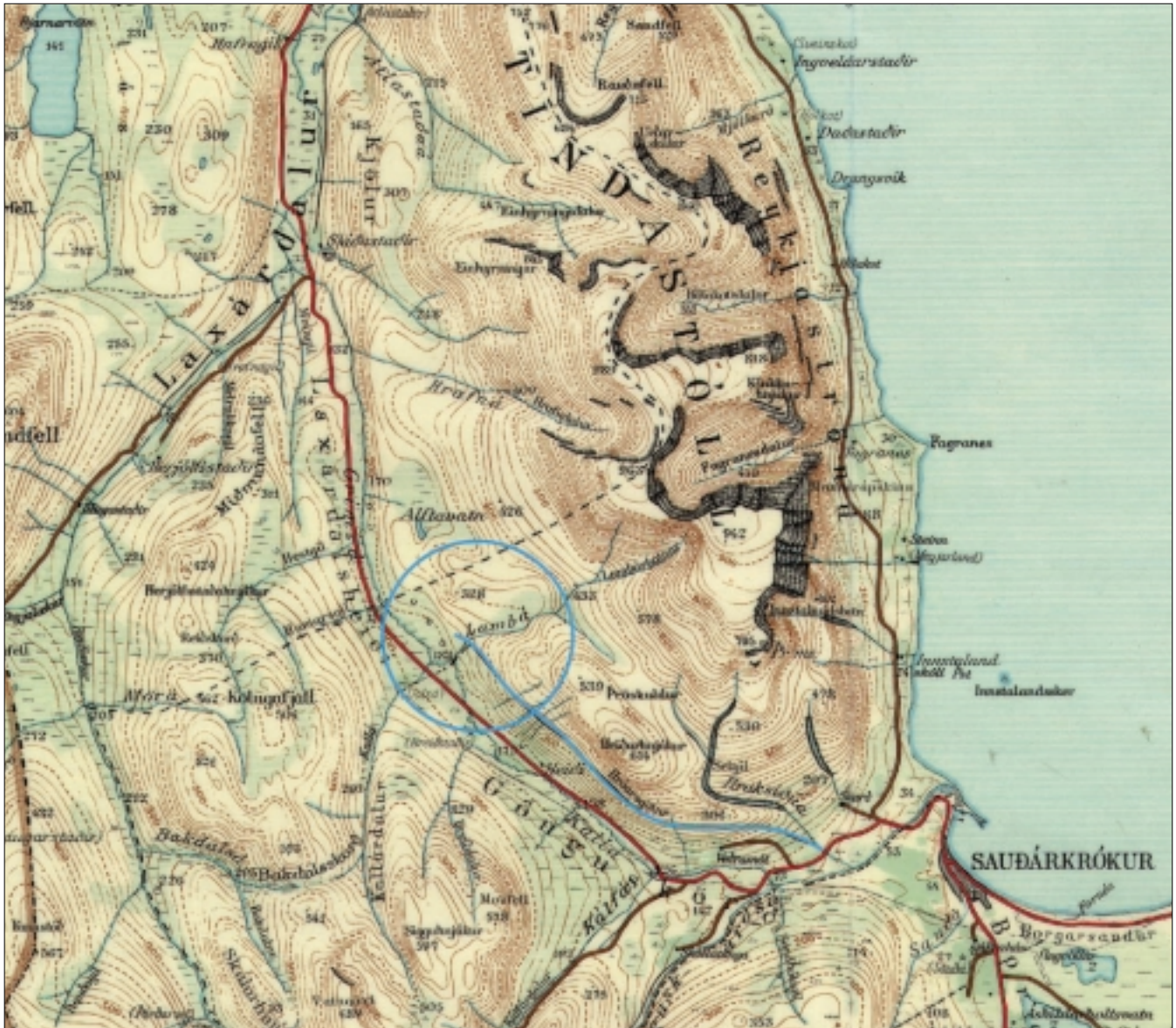
1. Staðsetning Hróarsgatna og Lambár á landakorti.