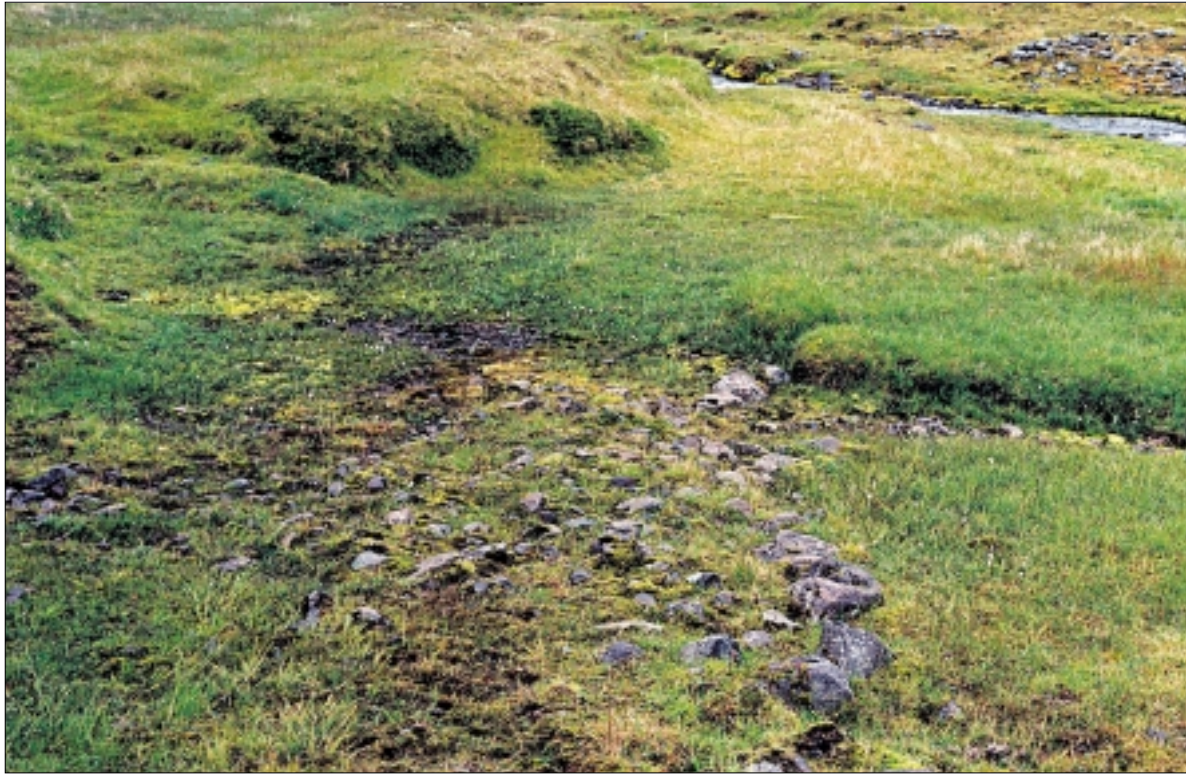
Hróarsgötur við Lambá. Horft til austurs. Steinlögn neðst í gílinu norðan við ána. Ljós. GOL-19980929.

framkvæmd megi hefja og með hvaða skilmálum. Við allar meiri háttar framkvæmdir, svo sem vegagerð, virkjanaframkvæmdir, flugvallargerð og veitulagnir, skal sá sem fyrir þeim stendur bera kostnað af nauðsynlegum rannsóknum. Setja skal í reglugerð nánari ákvæði um efni þessarar greinar.