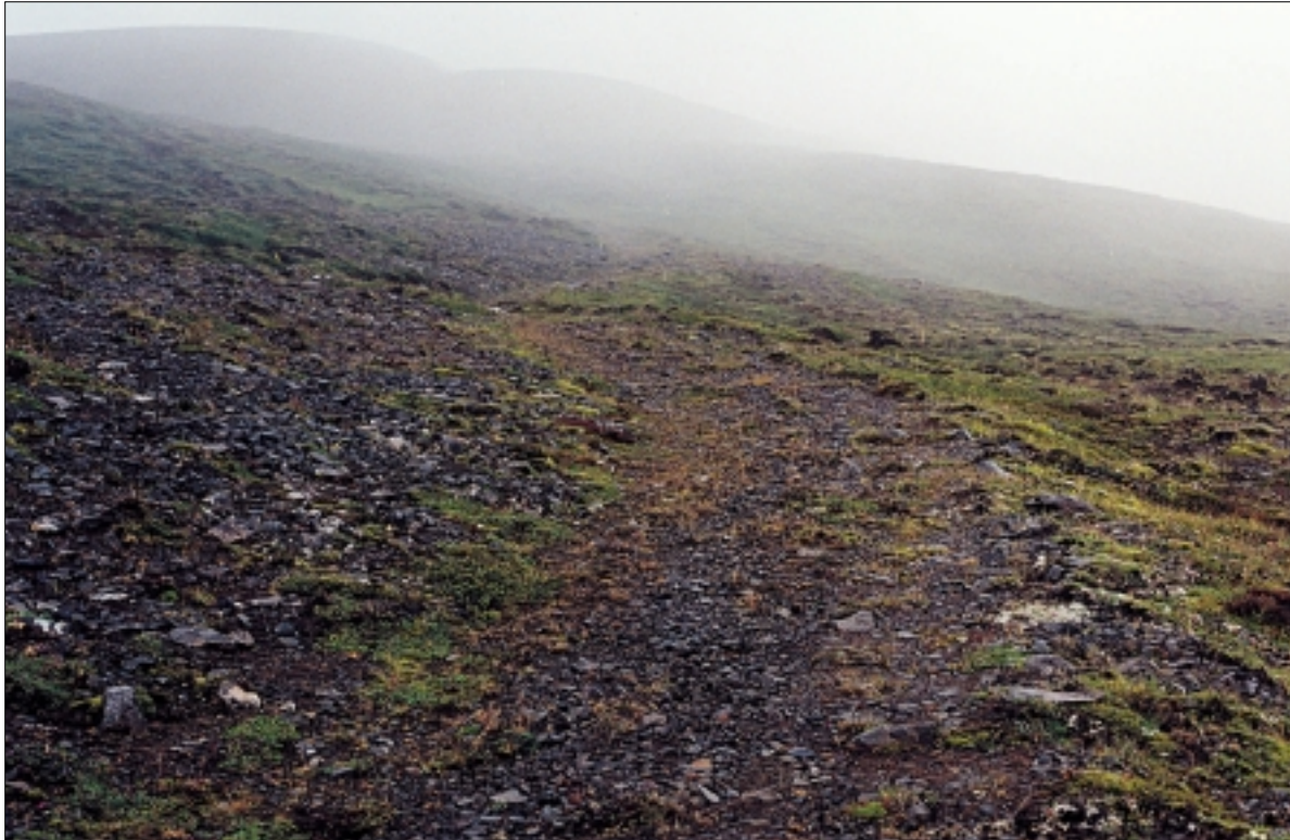
Horft til norðvesturs yfir Hróarsgötur þar sem þær koma að Lambá að norðanverðu. Ljós. GOL-19980931.

Vegagerðin hefur jafnframt fullvissað Þjóðminjasafnið um að farið verði með gát um þetta svæði og öllum framkvæmdum hagað með þeim hætti að sem minnstar skemmdir verði á Hróargötum og að hægt verði að sjá ummerki gatnanna meðfram nýja veginum. 6