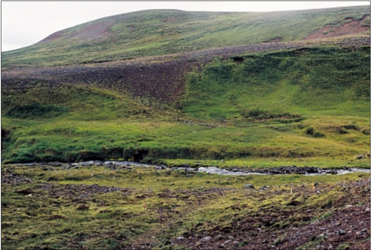
Horft til austurs þar sem Hróarsgötur koma upp úr gilinu við Lambá aðsunnanverðu. Ljós. GOL-19980930.

Hróarsgötur fengu skráningarnúmer 12 í skráningarbók Þjóðminjasafns.