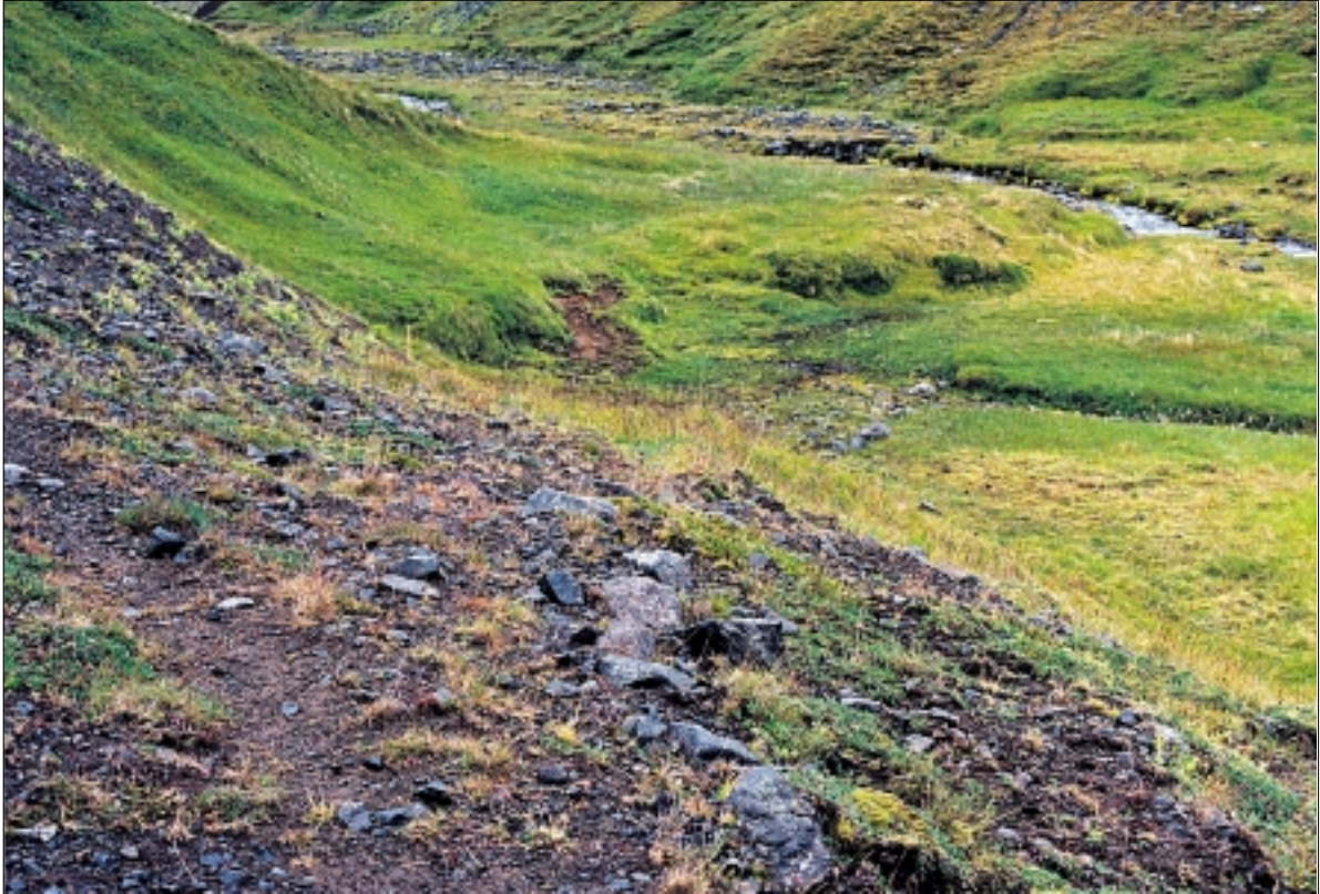
Horft til NA þar sem Hróarsgötur fara niður í gilið við Lambá. Steinaröð fremst á miðri mynd markar ytri brún götunnar. Til vinstri sést að skriður hafa fallið yfir hluta götunnar. Ljós. GOL 19980928.